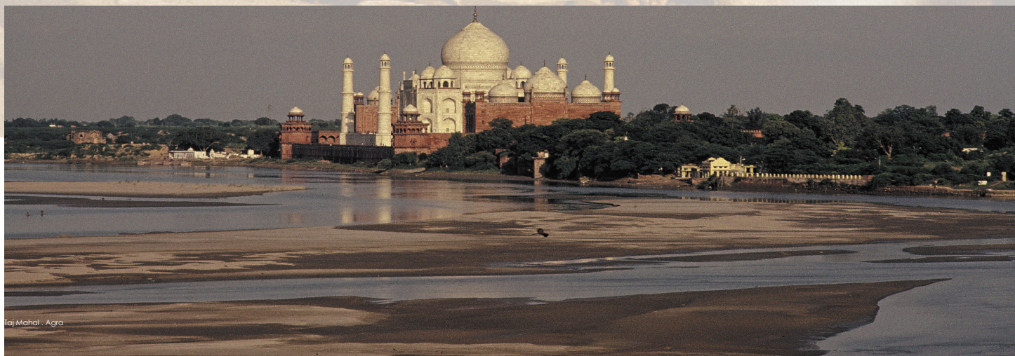
Taj Mahal - Agra

Es gibt viel zu entdecken – und zu hinterfragen. Reisen wir hin!