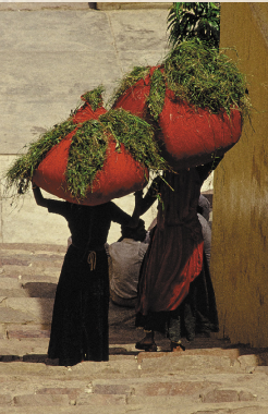
Frauen in Amber Fort, Rajasthan