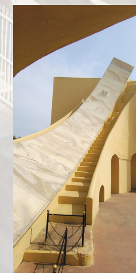
Jantar Mantar - Jaipur