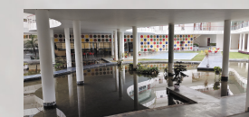
Pearl Academy - Morphogenesis Jaipur