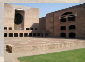
IIMA - Ahmedabad - Louis Kahn

Es gibt viel zu entdecken – und zu hinterfragen. Reisen wir hin!