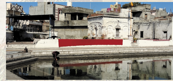
Gurdwara in Amritsar - als Vorschlag für eine individuelle Reiseverlängerung

hier geht's zur detaillierten Reisebeschreibung