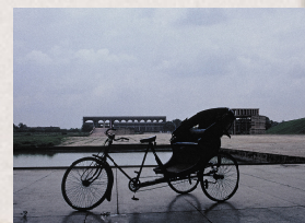
Gerichtshof - Chandigarh Le Corbusier