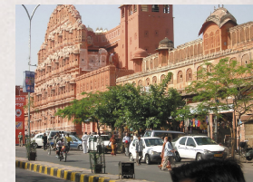
Hawa Mahal - Jaipur

Nur wenige Länder der Welt sind für den Architekten so spannend wie Indien. Selten zeigt sich der Zusammenhang zwischen den soziokulturellen und politischen Umständen einer Epoche und der zeitgenössischen Baukunst so deutlich wie hier