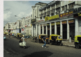
Connaught Place - New Delhi

Reiseleitung: Thomas Staender Fachbegleitung Architektur: Rainer Wetzels Veranstalter USP deluxe travel, München