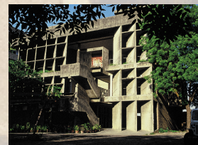
mills owners association building Ahmedabad - Le Corbusier