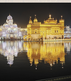
Goldener Tempel in Amritsar